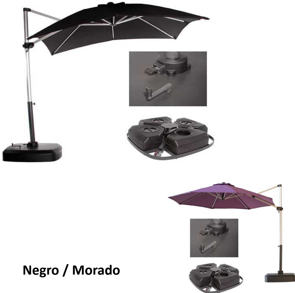
Negro / Morado